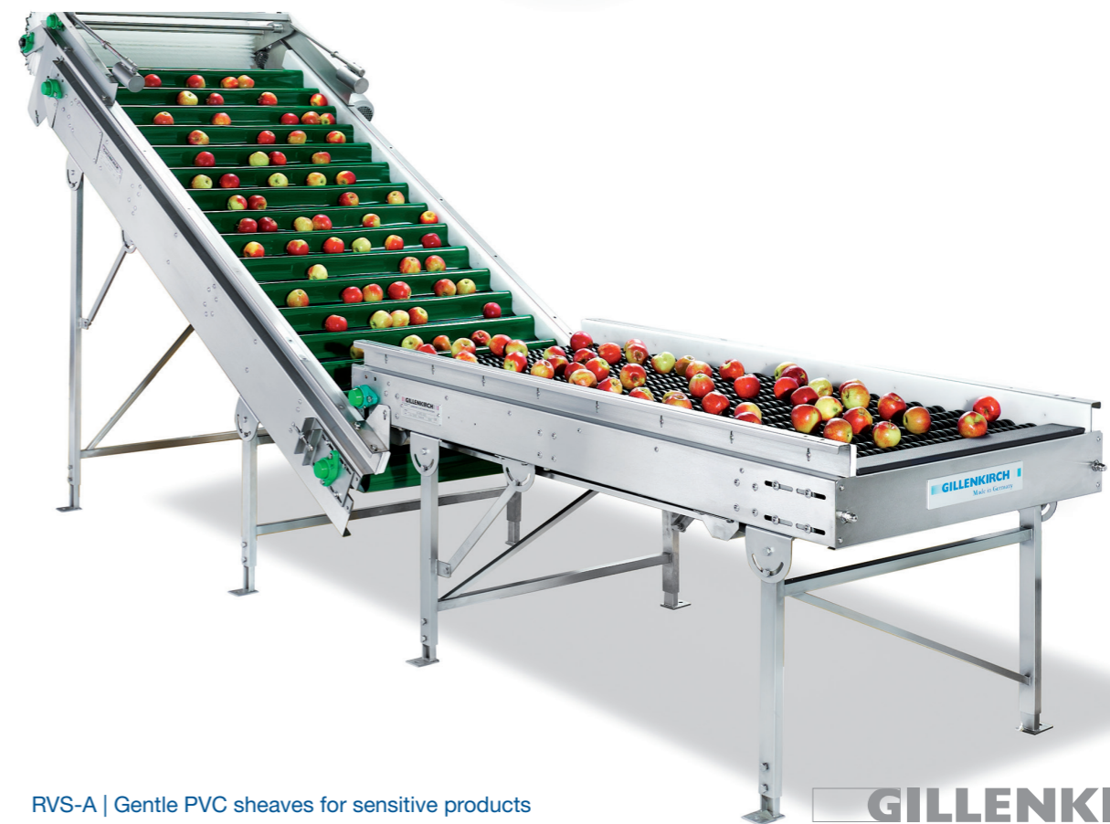
RVS-A | Gentle PVC sheaves for sensitive products RVS-A | Schonende PVC Scheiben für empfindliche Produkte

GILLENKIRCH YOUR PARTNER FOR COMPLETE SOLUTIONS