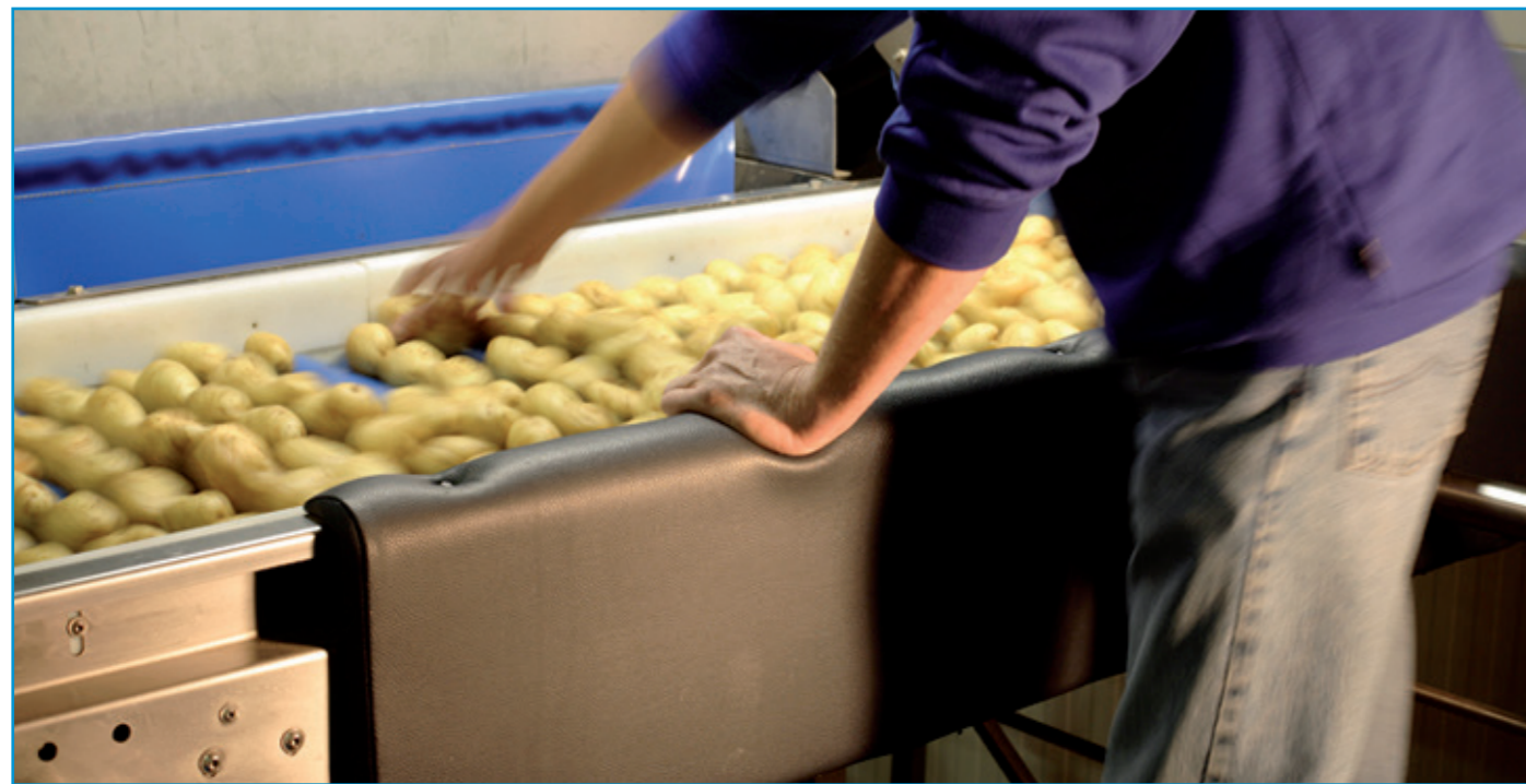
Padded, leather coated side guards for comfortable working Gepolsterte, lederbezogene Seitenleisten für ein komfortables Arbeiten